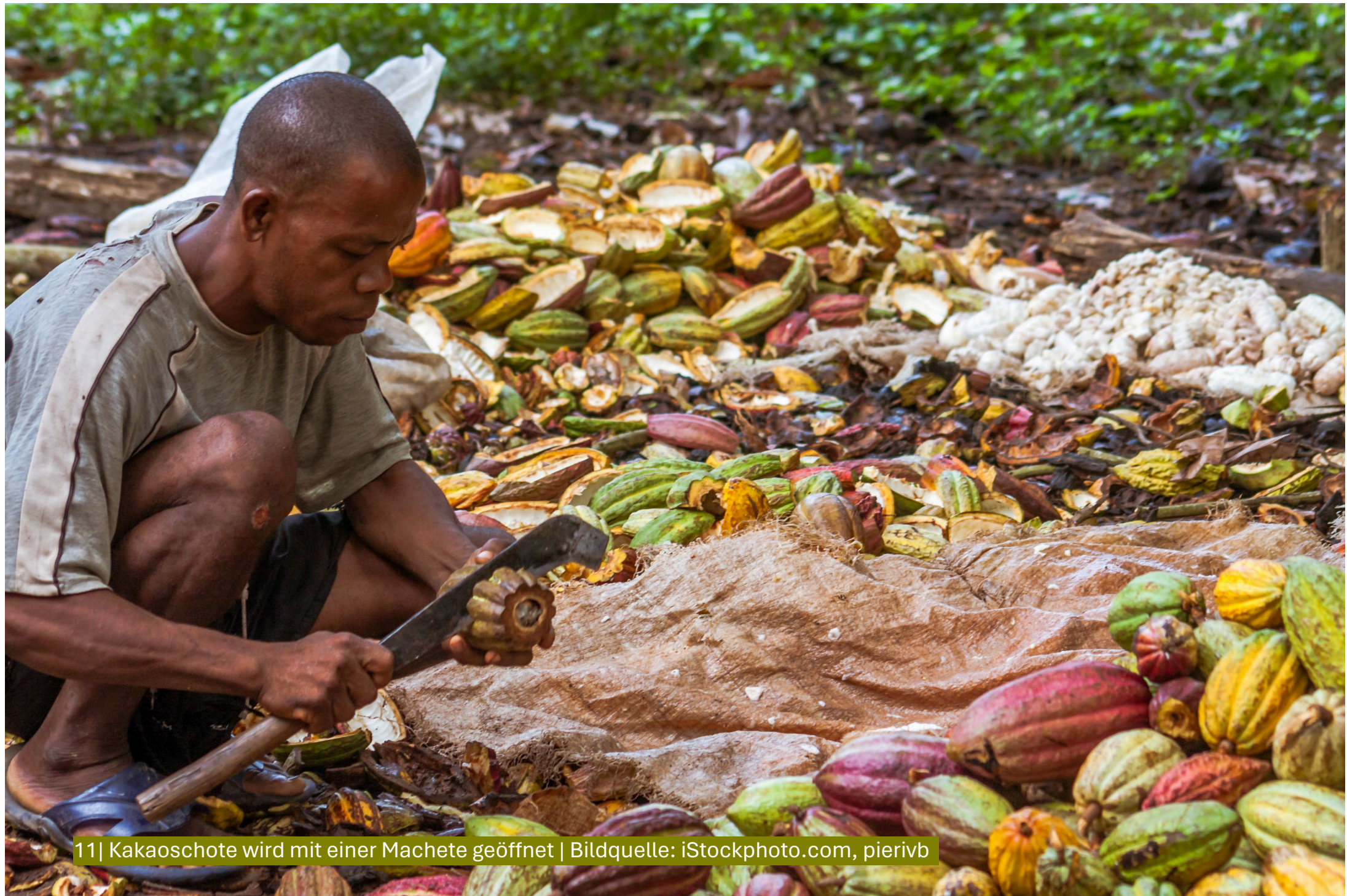
11| Kakaoschote wird mit einer Machete geöffnet