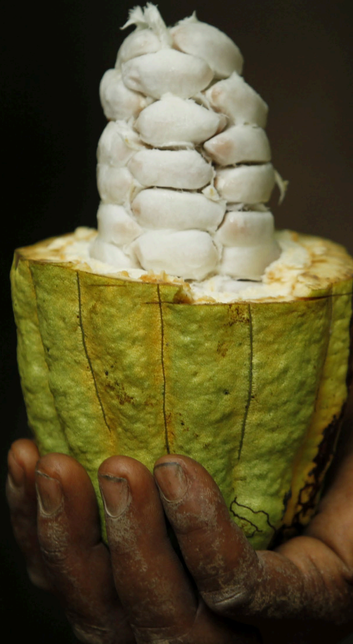
7| Geöffnete Kakao-Schote mit Pulpa und Bohnen