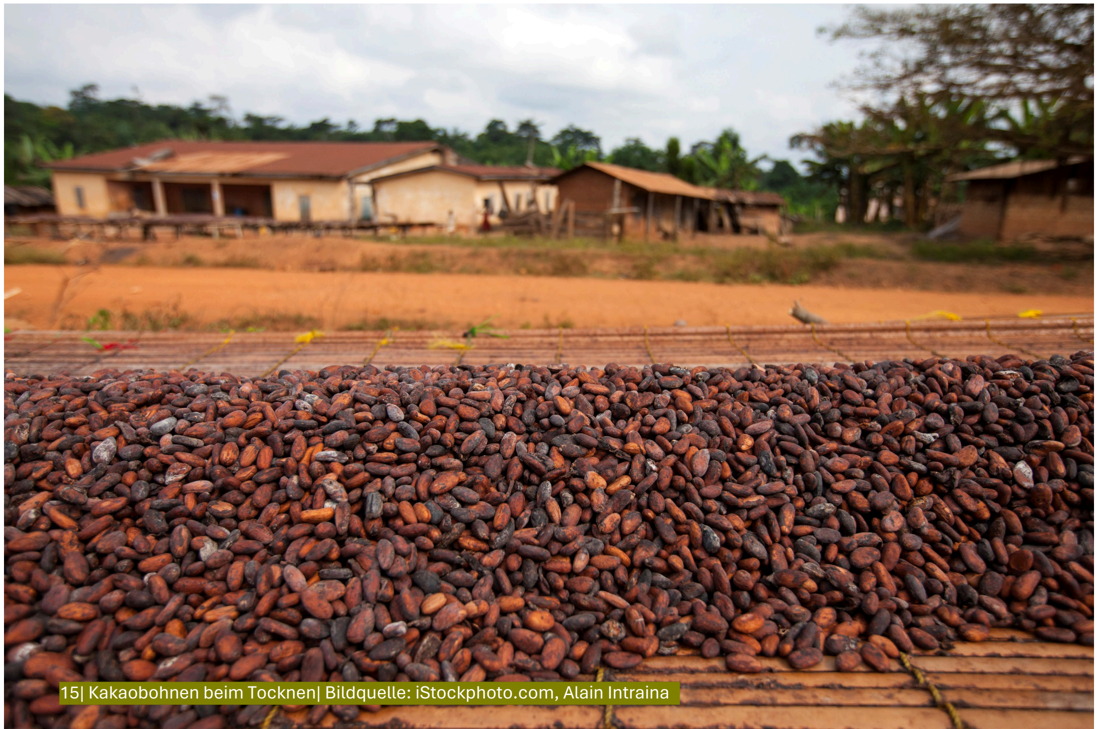
15| Kakaobohnen beim Trocknen