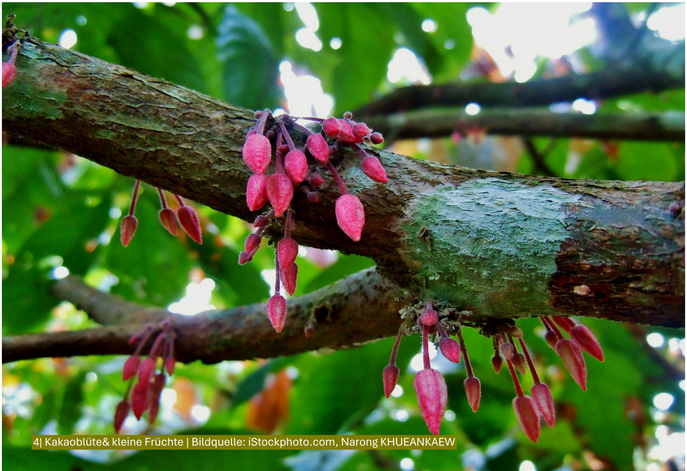
4| Kakaoblüte & kleine Früchte