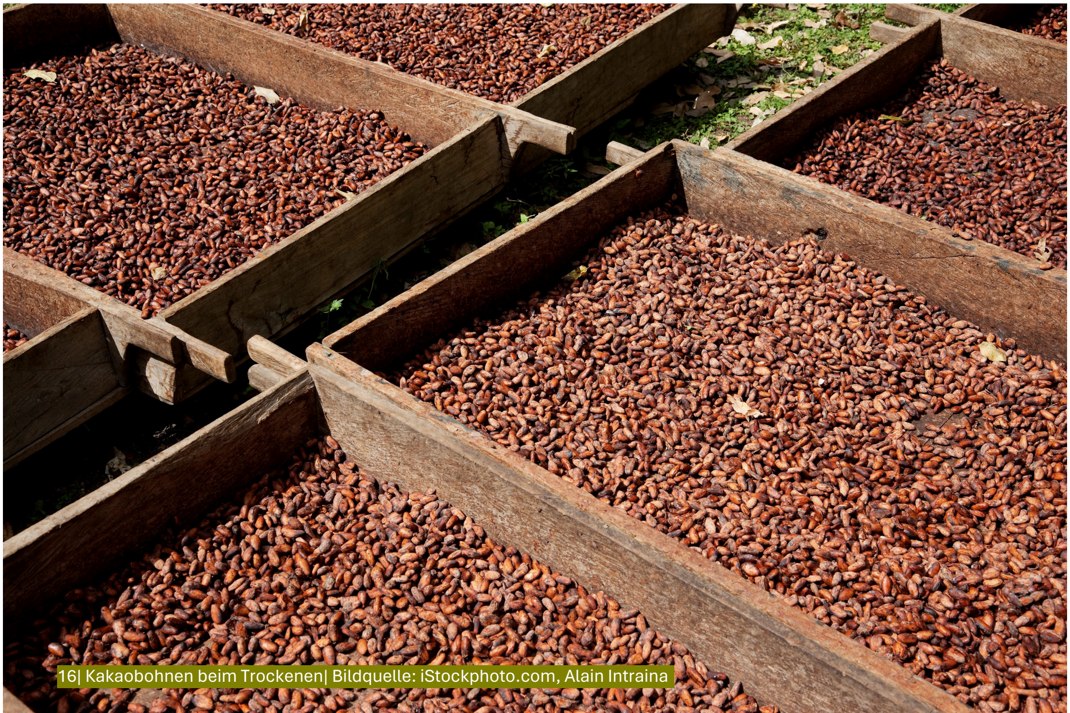
16| Kakaobohnen beim Trocknen