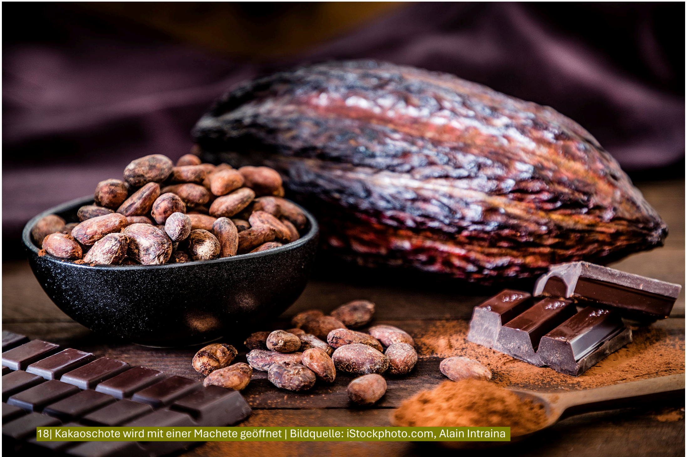
18| Kakaoschote wird mit einer Machete geöffnet