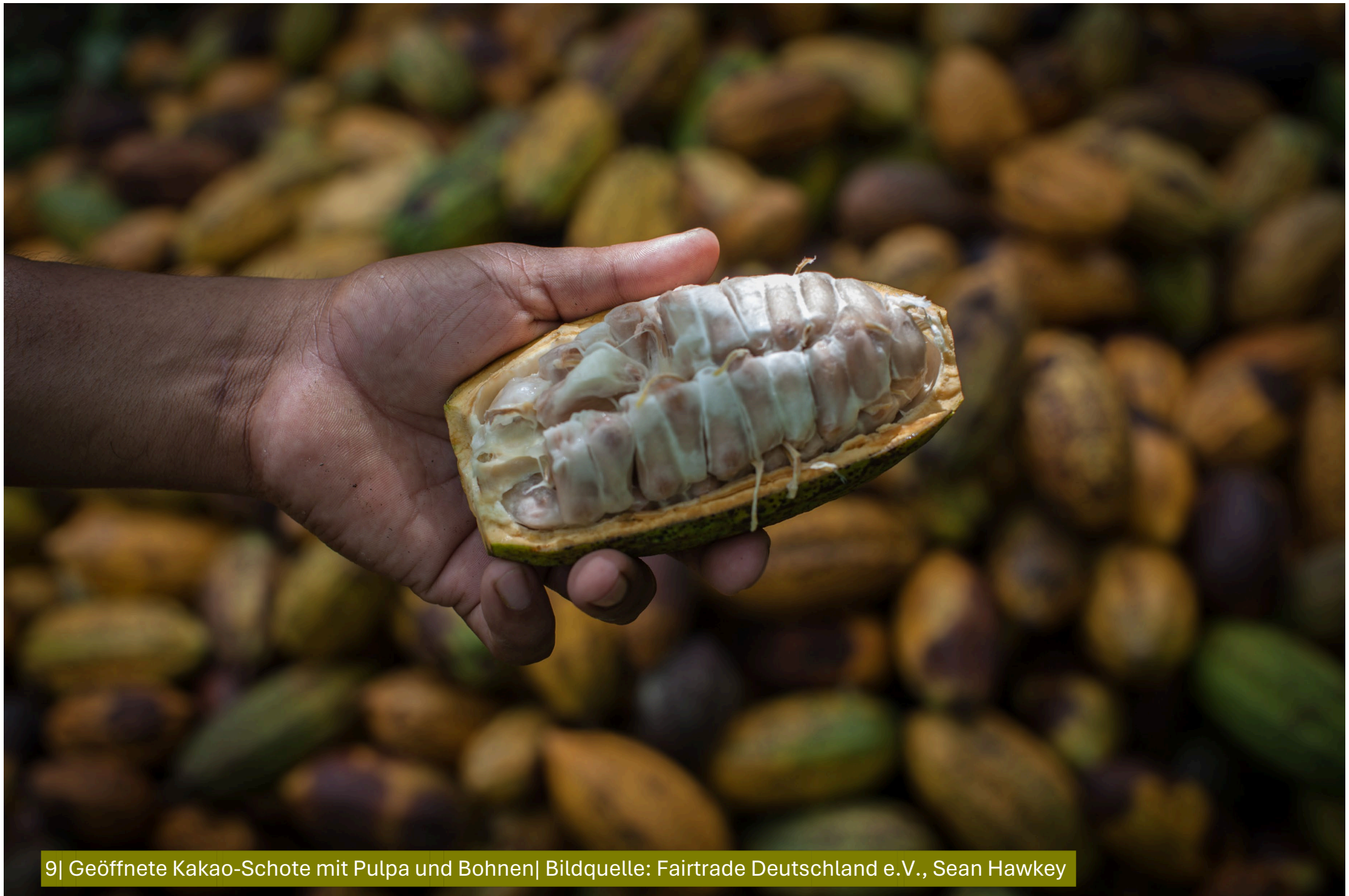
9| Geöffnete Kakao-Schote mit Pulpa und Bohnen| Bildquelle: Fairtrade Deutschland e.V., Sean Hawkey