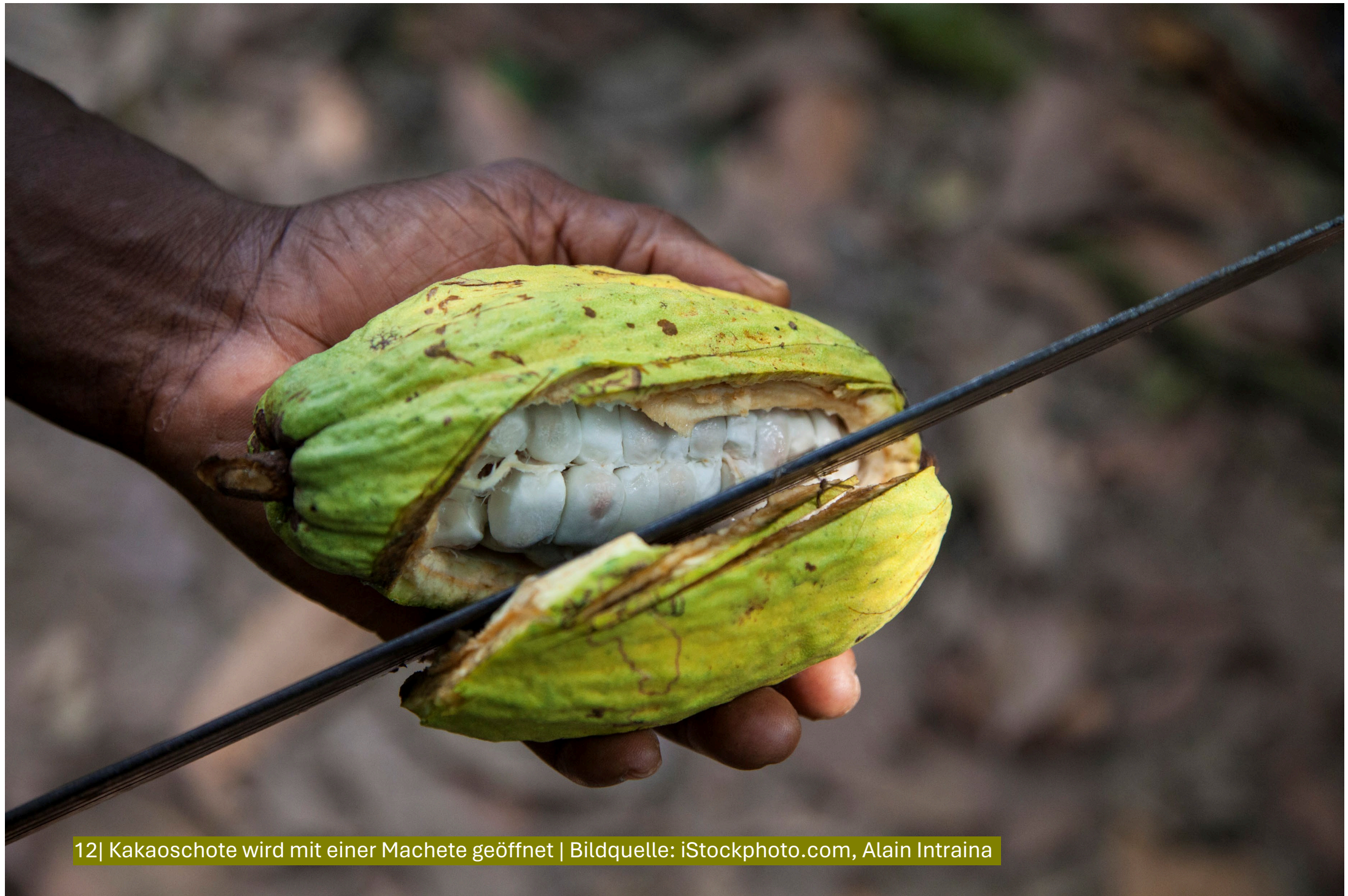
12| Kakaoschote wird mit einer Machete geöffnet