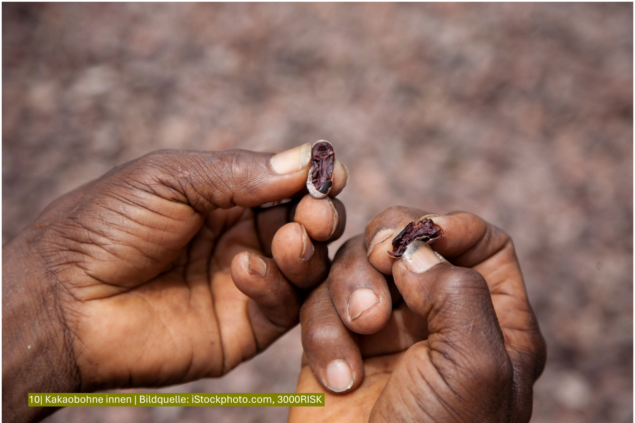
10| Kakaobohne innen | Bildquelle: iStockphoto.com, 3000RISK