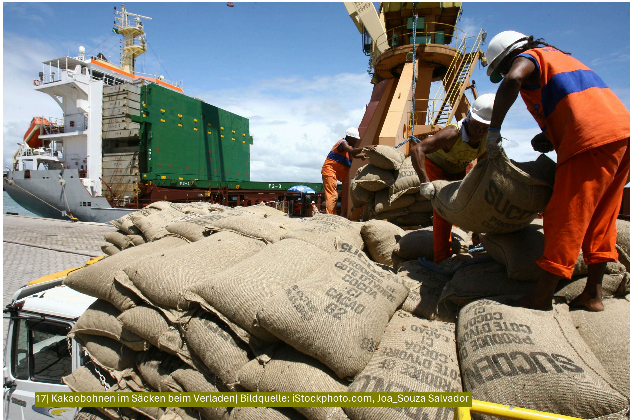
17| Kakaobohnen im Säcken beim Verladen